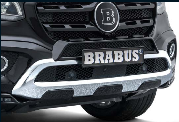
< BRABUS Frontaufsatz und BRABUS Einsätze für Unterfahrschutz

BRABUS front add-on part and BRABUS inserts for underride guard