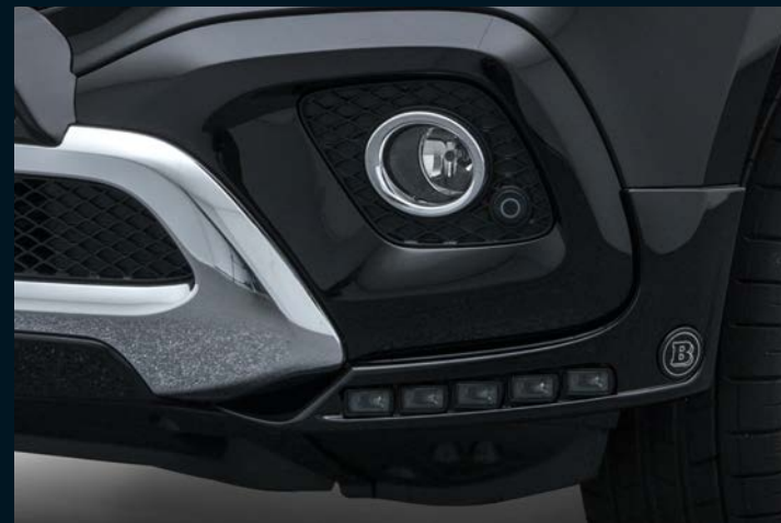
< BRABUS Frontschürzenaufsätze mit LED-Leuchten

BRABUS front add-on part and BRABUS inserts for underride guard