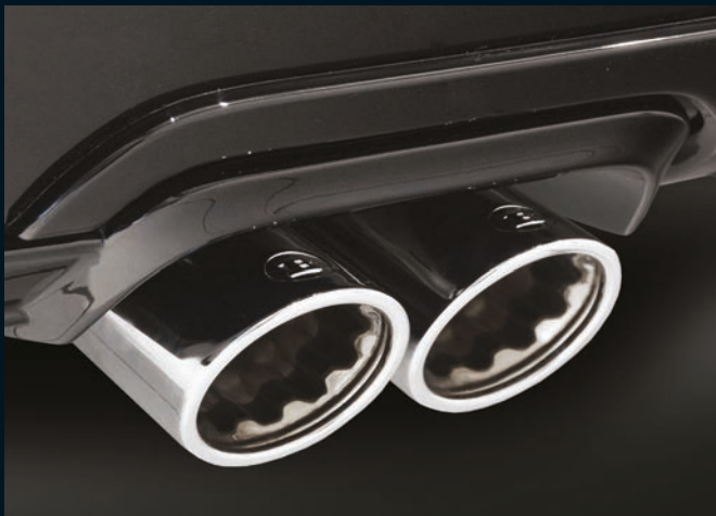
< BRABUS Sportauspuffanlage mit je 2 abgeschrägten Endrohren rechts und links

BRABUS PowerXtra D4 Base V 250 BlueTec + 33 kW/45 hp to 173 kW / 235 hp • 510 Nm