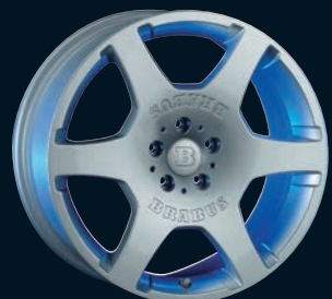
BRABUS Monoblock A 18"