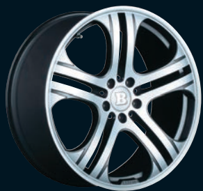
BRABUS Monoblock Q 18"