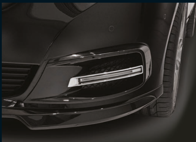
< Detail BRABUS Frontschürzenaufsätze und LED Positionslicht für Frontschürzenaufsätze

Detail BRABUS front bumper add-ons and LED position lights for front bumper add-ons