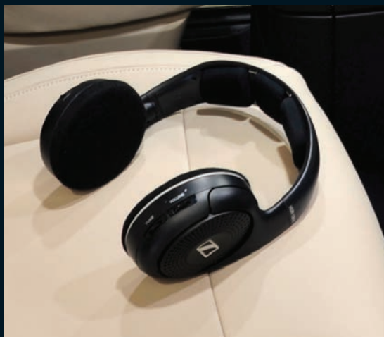
< Funkkopfhörer für Multimedia-Systeme