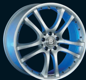
BRABUS Monoblock S 18"