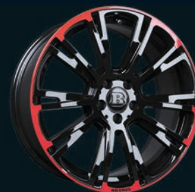
BRABUS Monoblock R "RED BLACK" 19"