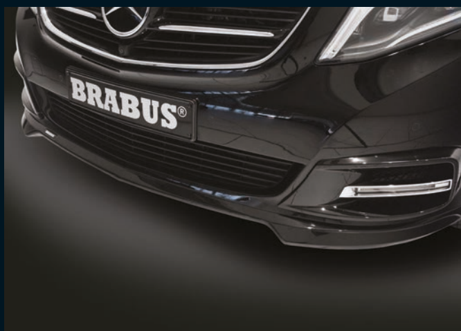
< BRABUS Frontspoiler