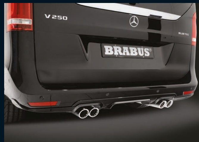
< BRABUS Heckschürzenaufsätze, 3-teilig

Detail BRABUS front bumper add-ons and LED position lights for front bumper add-ons