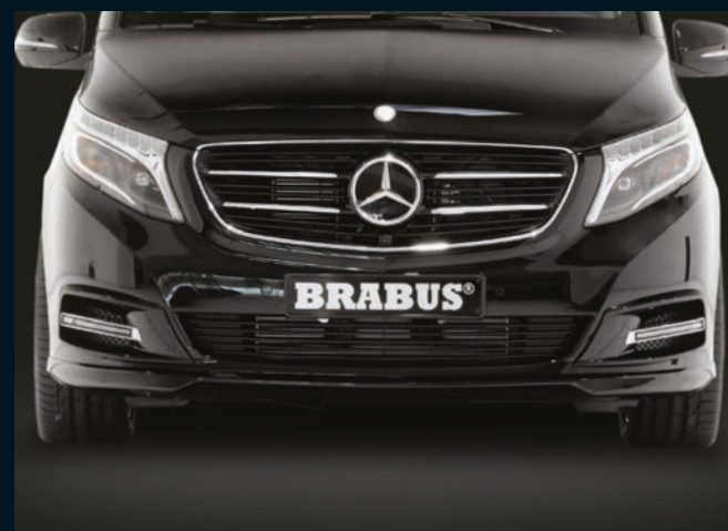
< BRABUS Frontschürzenaufsätze, LED Positionslicht und Frontspoiler

BRABUS front bumper add-ons, LED position lights and front spoiler