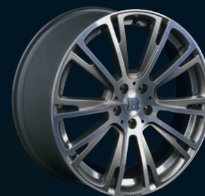
BRABUS Monoblock R 18" - 19"