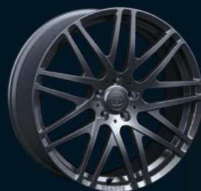
BRABUS Monoblock F "LIQUID TITANIUM" 18" - 19"