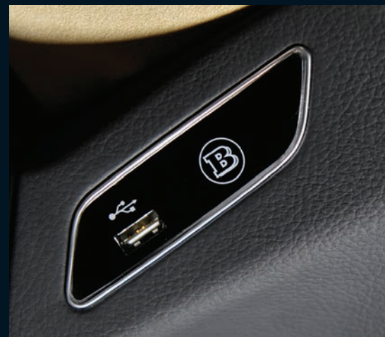
< Integrierter USB-Port