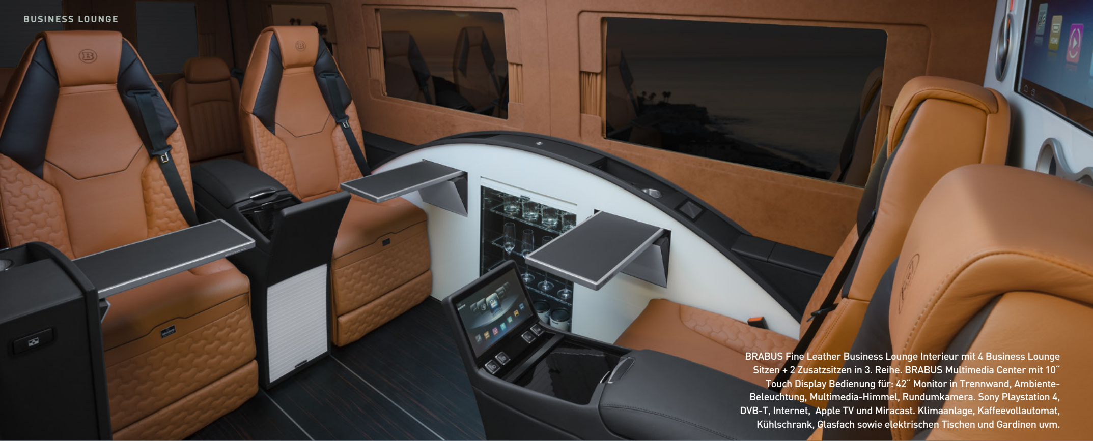
BRABUS Fine Leather Business Lounge Interieur mit 4 Business Lounge Sitzen + 2 Zusatzsitzen in 3. Reihe. BRABUS Multimedia Center mit 10" Touch Display Bedienung für: 42" Monitor in Trennwand, Ambiente-Beleuchtung, Multimedia-Himmel, Rundumkamera. Sony Playstation 4, DVB-T, Internet, Apple TV und Miracast. Klimaanlage, Kaffeevollautomat, Kühlschrank, Glasfach sowie elektrischen Tischen und Gardinen uvm.