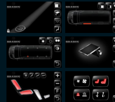
BRABUS "Touch Control Panel" 5 Zoll Einzelsitzmodul zur Steuerung.